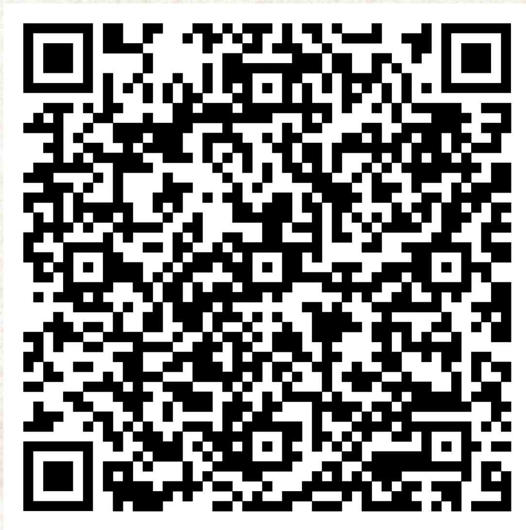
График (проект) проведения консультаций