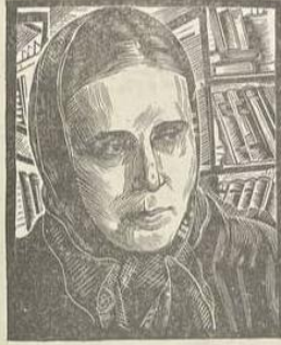
Людмила Константиновна ТАТЬЯНИЧЕВА